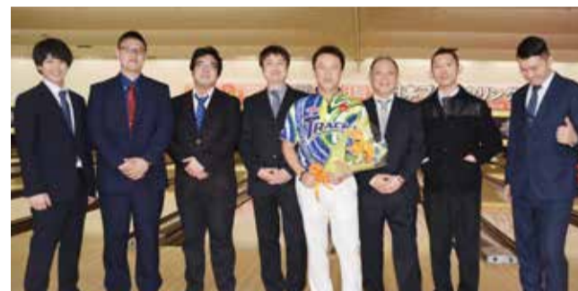
▲公式戦最後の舞台となった全日本選手権では、仲間から労いの花束が贈られた

また、ジュニアの育成に携わるようになって「自分たちはプロとして憧れの存在たり得ているのか?」と自問したとき、とくに男子プロのトーナメントは、業界外の人たちが応援したくなるような雰囲気、乏しいこと