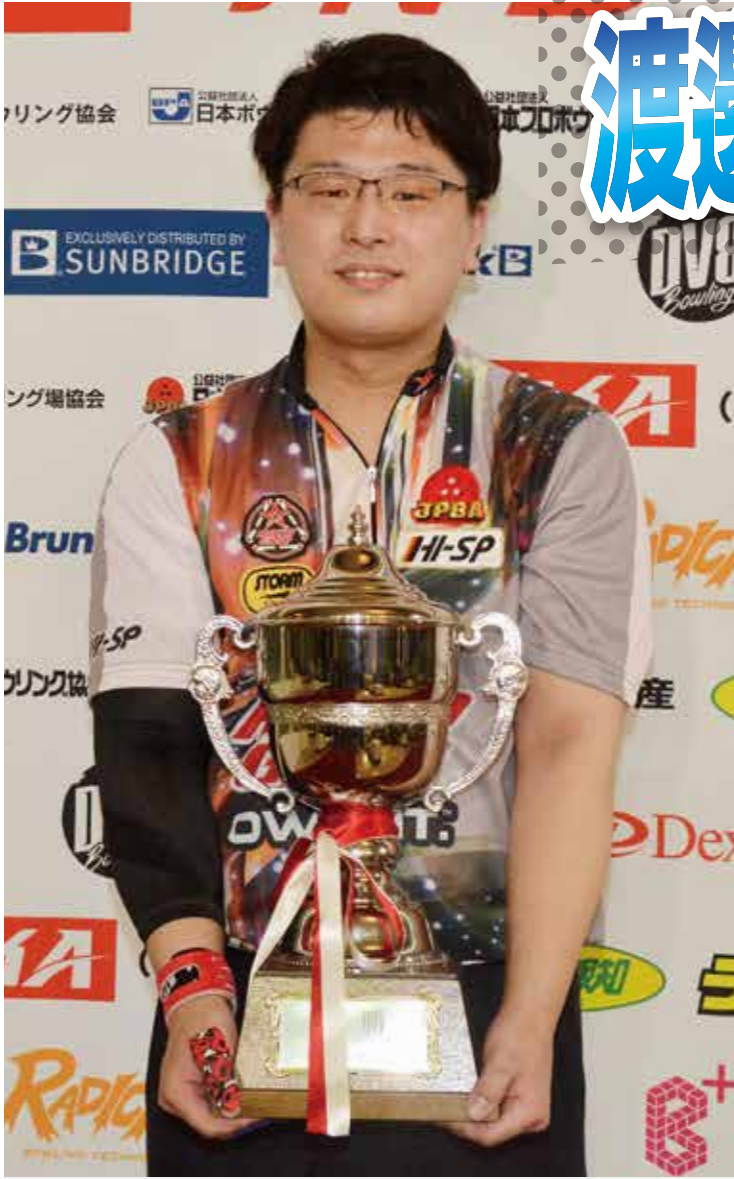
▲2019年のラウンドワン JPBA決勝大会に続くタイトル奪取で両目を開けた