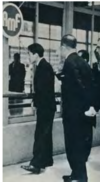
▲最新のマシンに興味深くご覧になられる当時の皇太子殿下

また、同見本市には当時の皇太子殿下(この4月に退位される今上天皇)も来臨され、画期的なハイテク・ボウリングマシンを熱心に見学される様子が多数のメディアで報じられたことも、ボウリング界にとっては大きな追い風となった。